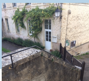
une main courante pour l'escalier de l'école