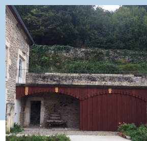
une élégante palissade sous la passerelle de la Croisée des Sarmates