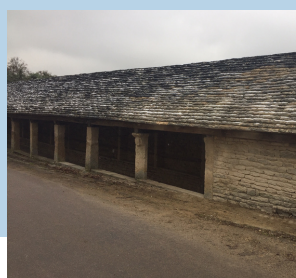
la mise aux normes électrique dans les halles et la bibliothèque